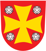
Kirkkohallitus / kasvatustyö ja nuorisotyö