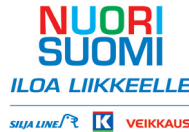
Nuori Suomi ry