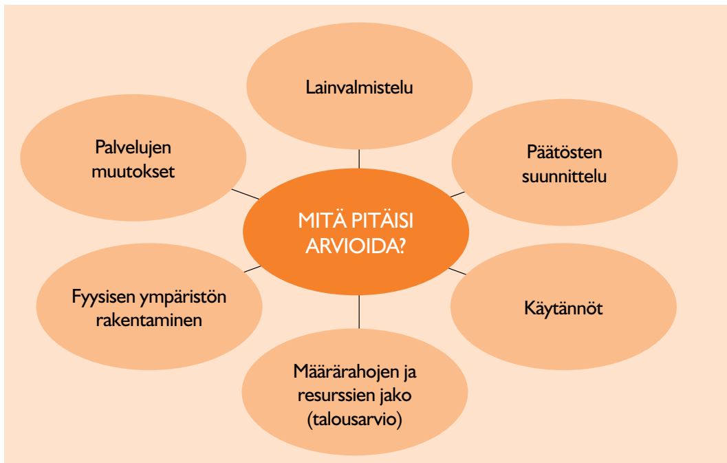
Kuvio 1. Lapsivaikutusten arvioinnin kohdentuminen.

Yhteenvedona voi todeta, että lapsen näkökulma tulee huomioida valtionhallinnossa ja/tai kuntatasolla päätösten suunnitteluvaiheessa (päätoisvaihtoehtojen myönteiset/kielteiset vaikutukset), käytäntöjen tarkastelussa, lainvalmistelussa, määrärahojen ja resurssien jaossa (talousarvio) ja kuntien palvelujen muutoksissa (organisatoriset, hallinnolliset muutokset) sekä fyysisen ympäristön rakentamisessa. Oheinen kuvio 111 (Kuvio 1) havainnollistaa asiaa.