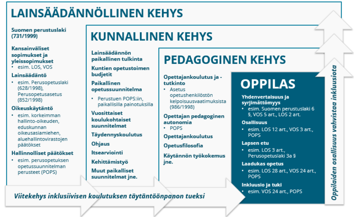
Kuvio 1. Viitekehys, joka havainnollistaa Suomen koulutusjärjestelmää ja sen tukea perusopetuksen kaikille oppilaille suunnatun inklusiivisen koulutuksen toteuttamiselle (Poikola, 2025).